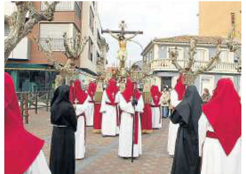
Un momento del Vía Crucis del Calvario de Cintruénigo.