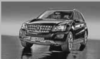
Clase M 300 CDI Desde 49.900 € (varios modelos) 4Matic