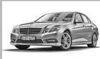
Clase E mod. actual 38.900 € Diesel (3 unidades) Ahorro 30% sobre P.V.P.