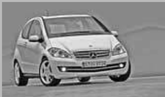
Clase A 170 13.900 € Diesel y gasolina (varias unidades) Ahorro hasta 41% sobre P.V.P.

Un año más, la Guardia de Honor de Alabarderos de San Juan Bautista de Tudela fue parte importante en la jornada de ayer. Los miembros del grupo, pertenecientes al centro cultural Miguel Sánchez Montes del barrio de Lourdes, desfilaron al ritmo de timbales y tambores por las principales calles de la ciudad y escoltaron a la Virgen en su procesión. ALDANONDO