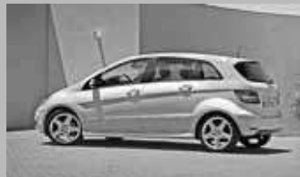
Clase B 170 18.500 € Diesel y gasolina (varias unidades) Ahorro hasta 36% sobre P.V.P.