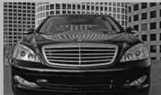
Clase S 320 CDI 62.500 € Año 2009 Ahorro 30% sobre P.V.P.