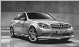
Clase C 180K 24.900 € Diesel y gasolina (varias unidades) Ahorro hasta 30% sobre P.V.P.