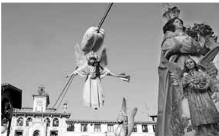
El niño llega braceando hasta la imagen de la Virgen.