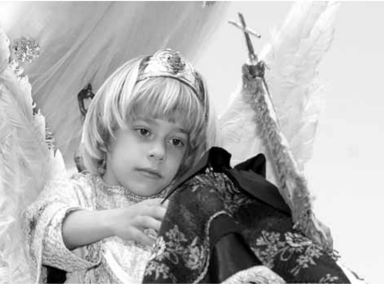
El niño llega braceando hasta la imagen de la Virgen, con gesto serio y concentrado.