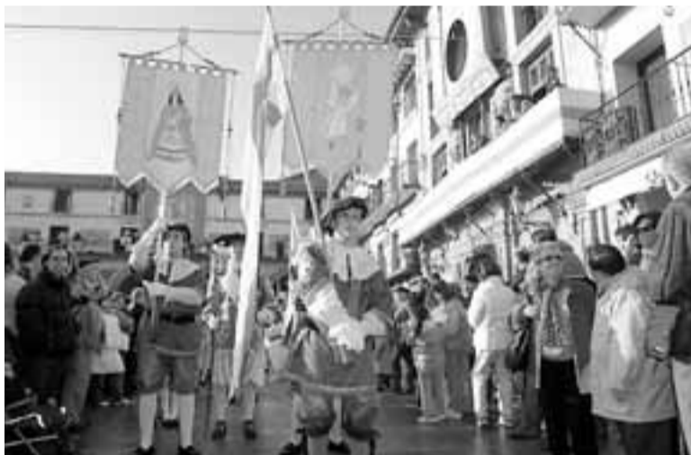
Los alabarderos, antes de empezar la procesión.

● Años. Es la edad que suele tener el niño elegido para encarnar la figura del Ángel. Se selecciona cuando cuenta con 6 años para que el día de la ceremonia tenga, como máximo, 8.