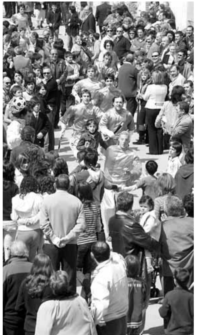
Judas, al frente, huye de la patrulla de romanos.