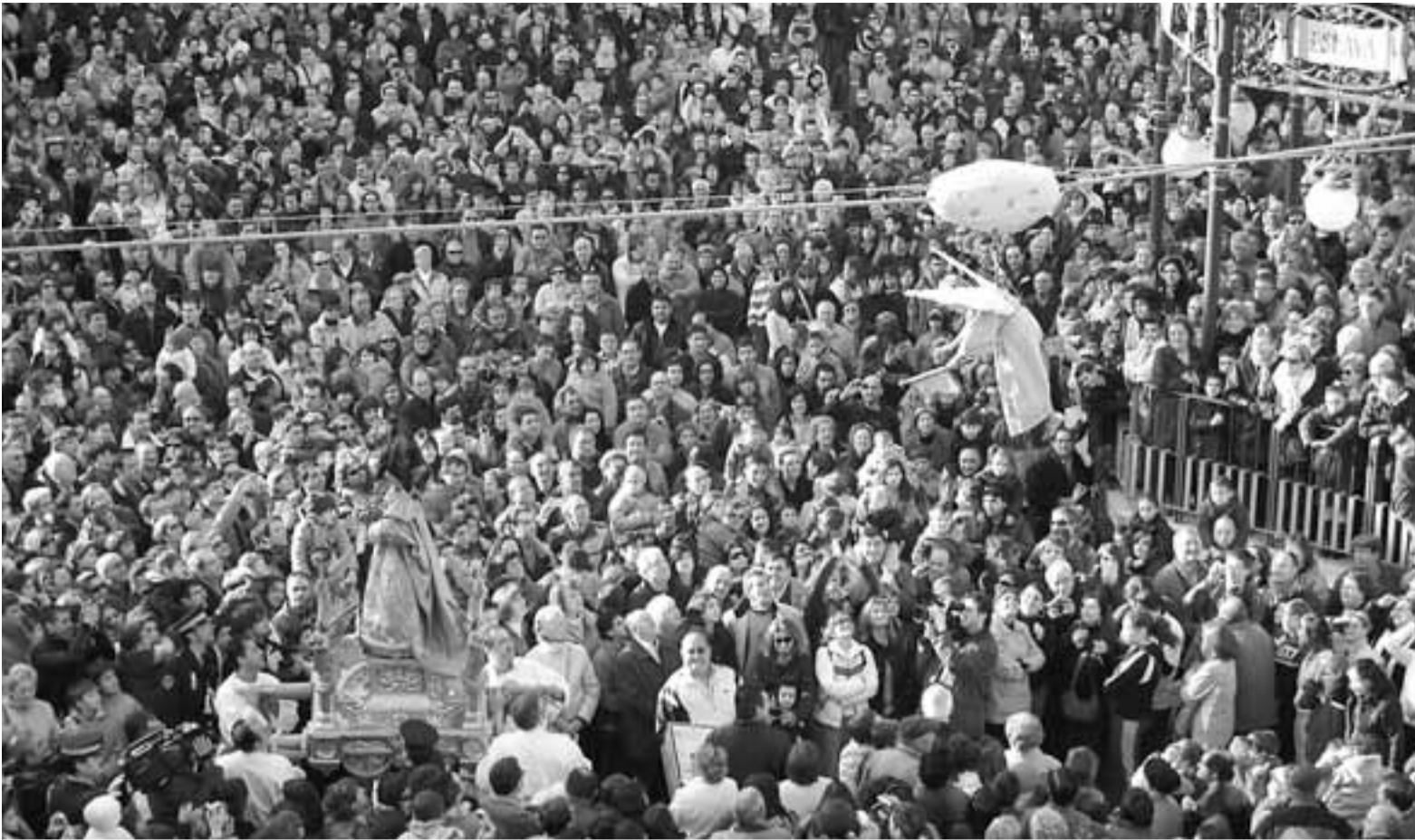
El Ángel se acerca a la Virgen, ante la mirada de miles de espectadores en la plaza Nueva de Tudela.