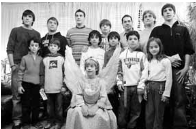
Los 'ángeles' de años precedentes, juntos antes de la ceremonia.