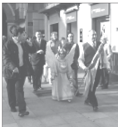
De camino a la Casa del Reloj