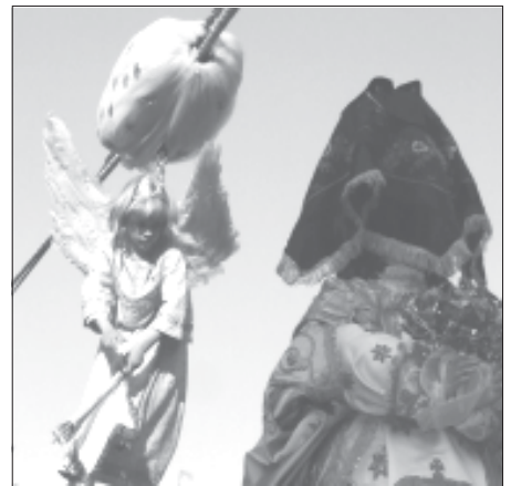
Aproximación hacia la Virgen