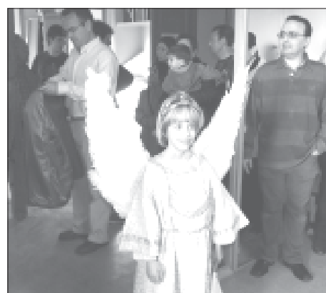
Llega a la Casa del Reloj