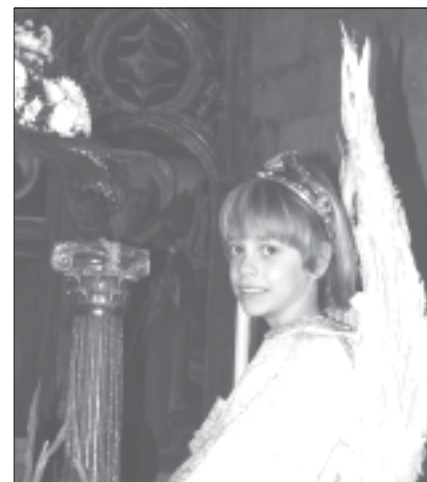
Feliz tras terminar la jornada