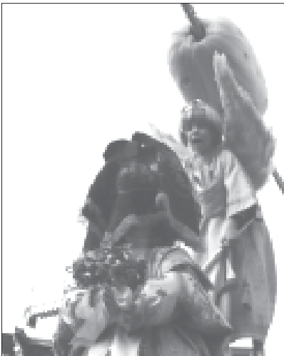
El Angel anuncia la resurrección de Jesús