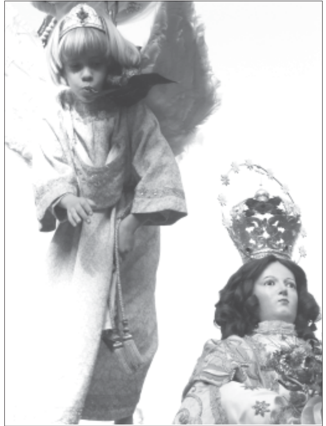
El Angel ha quitado con éxito el velo a la Virgen

Le quitó el velo que cubría su rostro, se lo echó a la primera sobre uno de sus hombros y emprendió el camino de regreso a la Casa del Reloj. El niño respiró tranquilo, como sus padres que, emocionados, presenciaron una escena que quedará grabada en la memoria y formará parte de la pequeña historia de esta familia tudelana.