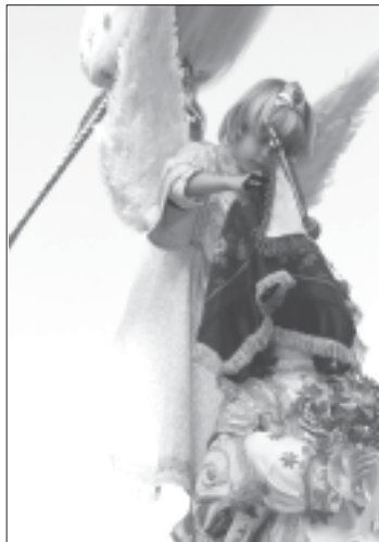
Instante antes de quitar el velo