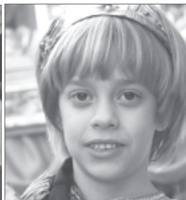
Durante la mañana se mostró sereno