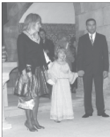
En la seo tudelana con sus padres