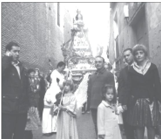
En marcha hacia la Catedral