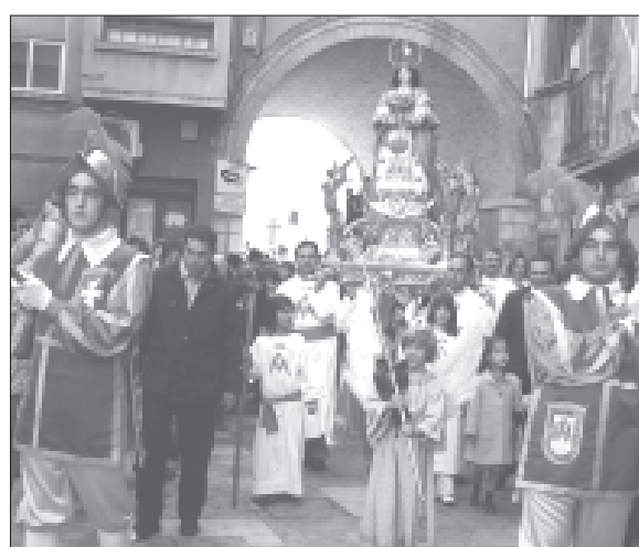
Finalizada la «Bajada» es acompañado por la guardia de honor