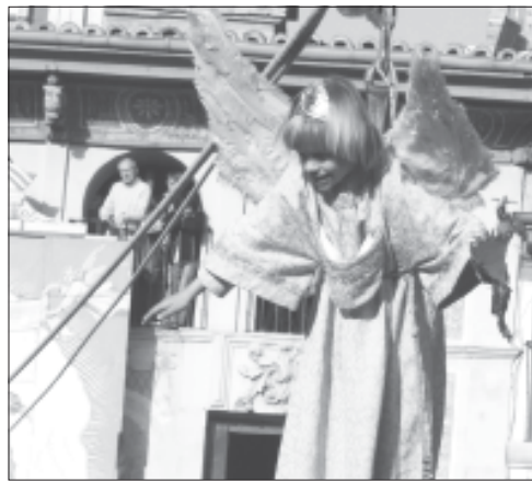
Saludo a los compañeros del colegio