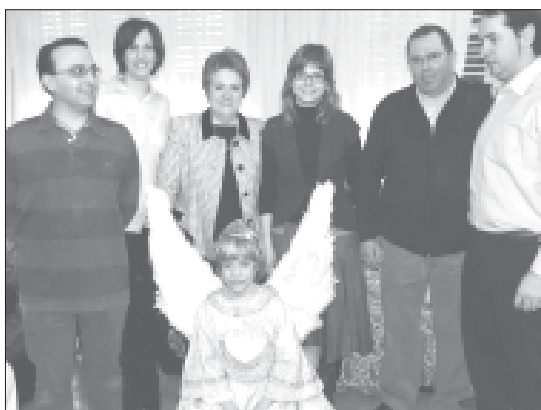
Posando tras ser vestido