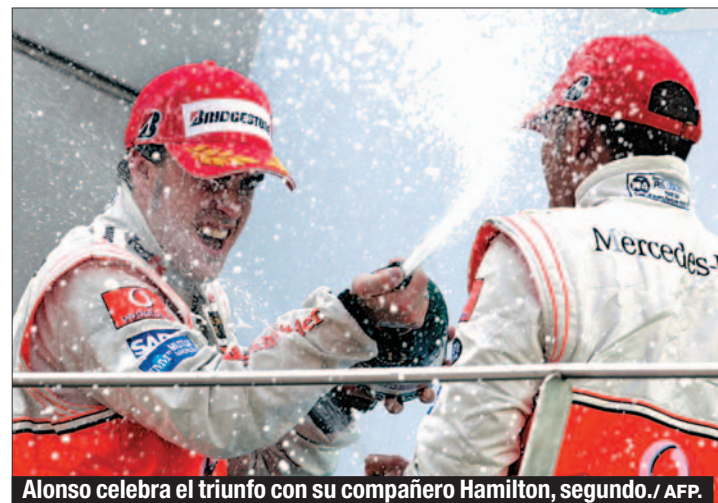
Alonso celebra el triunfo con su compañero Hamilton, segundo.