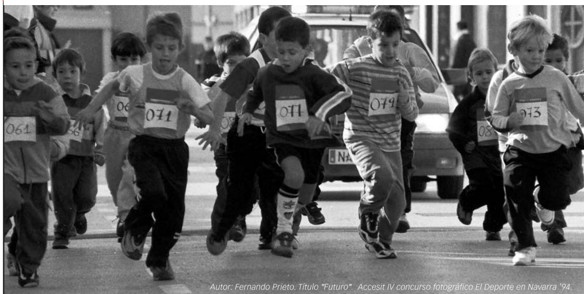
Autor: Fernando Prieto. Título "Futuro". Accesit IV concurso fotográfico El Deporte en Navarra '94.

Si crees que tú también puedes ayudar a mejorar el futuro del deporte en Navarra, es tu turno.