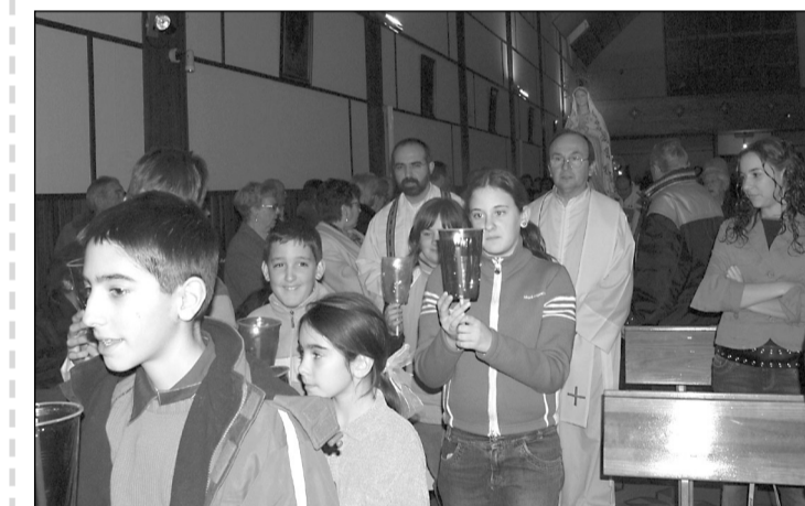
■ Durante la celebración, la Virgen salió en procesión por la iglesia.

De las 17.515 personas con enfermedad mental diagnosticadas en el 2004 en la red sanitaria pública, 2.186 fueron atendidas en el Centro de